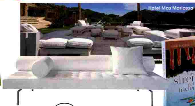
Hotel Mas Mariassa