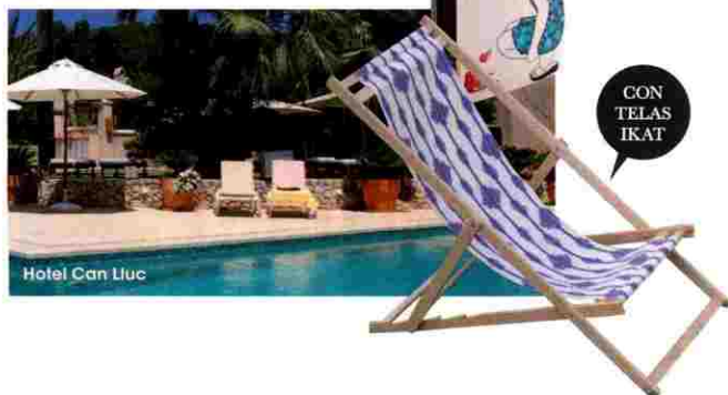
Hotel Can Lluç